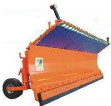
Abb. 643 Sněhová radlice s hydr. nakláp. - 35°, šířka 2 - 3,2 m, pracovní záběr 1,7 - 2,7 m, lze doobjednat gumový břit, ochranná plachta a obrysová světla