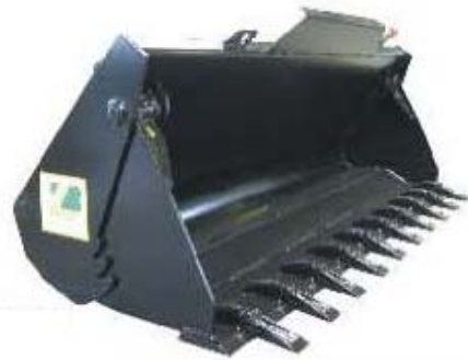
Abb. 632 Víceúčelová lžíce 4 v 1, objem 0,55 - 0,95 m 3 , šířka 1,6 - 2,5 m