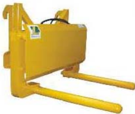
Abb. 636 Hydraulický roztahovací nosič žoků nebo kulatých balíků, nosnost 1,5 t