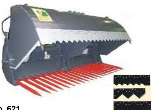
Abb. 621 Vidle na siláž s vykusovačem typ "A", objem 1 - 1,54 m 3 , šířka 1,57 - 2,41 m, lze vybrat ze tří břitů