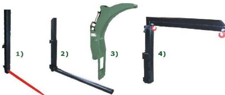
Abb. 610 1) Nosič se špicí na rám (délka špice 1,1 - 1,4 m) 2) Nosič s kulatinou na rám (délka kulatiny 1,2 m) 3) Hydraulické kleště na rám (min. průměr ca. 500 mm) 4) Rameno s nosnými háky Big-Bag vaků na rám (nosnost 500 kg)