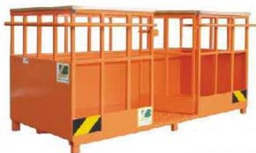
Abb. 640 Pracovní plošina typ "BLA II", nosnost 250 kg, šířka 2,4 m