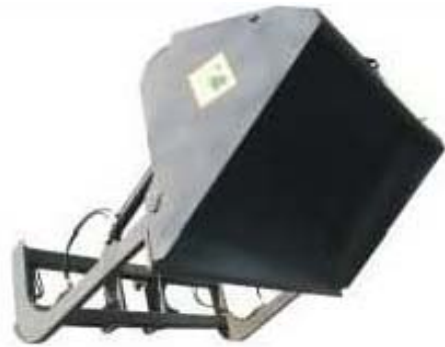
Abb. 607 Vysokovýklopná lžíce, objem ca. 0,95 - 5,1 m 3 , šířka 1,4 - 3 m, lze doobjednat vyměnitelný břit