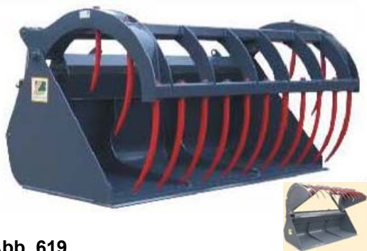
Abb. 619 Lžíce na siláž s přidržovákem typ "A XL", objem 2,2 - 2,8 m 3 , šířka 2,2 - 2,8 m, lze doobjednat vyměnitelný břit a plné boky