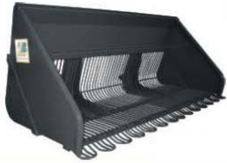
Abb. 630 Lžíce na brambory, objem 0,9 - 2,2 m 3 , šířka 1,8 - 2,6 m