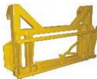
Abb. 646 Adaptérový rám - z JCB nástavby na Euro-rychlovýměňý systém