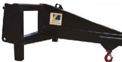
Abb. 638 Jeřábové rameno, nosnost 3,2 t, délka 0 - 2 m