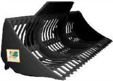
Abb. 631 Lžíce na kamení, objem 0,58 - 0,9 m 3 , šířka 1,6 - 2,5 m