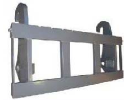
Abb. 611 Nosný rám na paletové vidle a ostatní s nosností 2,5 - 4,5 t, šířka 1,2 m