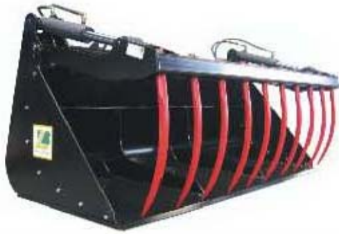
Abb. 606 Multifunkční lžíce s přidržovákem a odnímat. boky, objem 1,13 - 1,70 m 3 , šířka 1,6 - 2,4 m