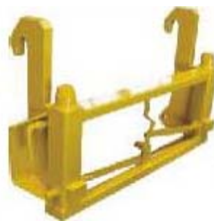
Abb. 648 Adaptérový rám - z JCB nástavby na John Deere nebo jiné nástavby (tel. nebo kol. nakl.)