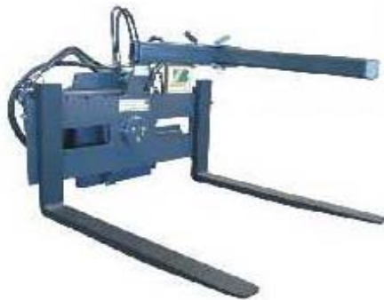
Abb. 612 Otočné paletové vidle s nosností 2,5 - 3,5 t, šířka rámu 1,2 m, délka vidlí 1,1 m