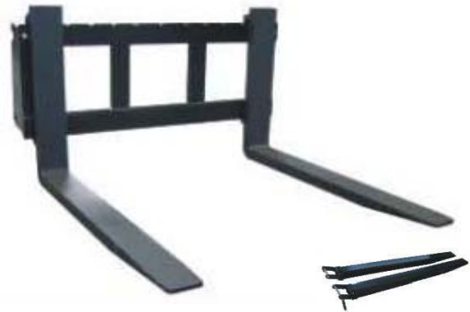
Abb. 609 Paletové vidle s rámem (boční posuv) s nosností 2,5 - 3,5 t, šířka rámu 1,2 m, délka vidlí 0,9 - 1,8 m, lze doobjednat nástavce na vidle a hydr. boční posuv