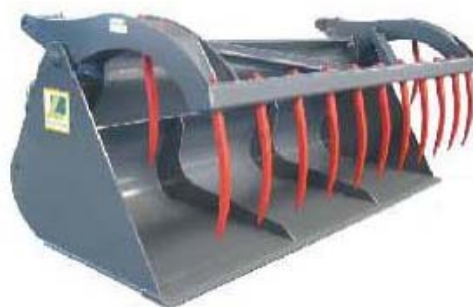
Abb. 618 Lžíce na siláž s přidržovákem typ "A", objem 1,3 - 2,2 m 3 , šířka 1,6 - 2,8 m