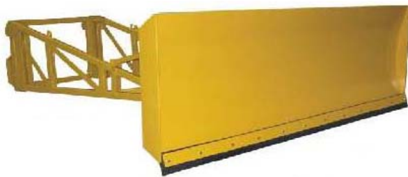
Abb. 608 Nahrnovač s nástavcem a pryžovou lištou, šířka 2,2 - 3 m