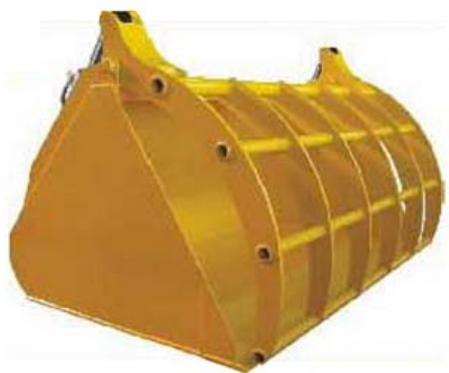
Abb. 635 Lehká lžíce s přidržovákem, objem 2,6 - 3,6 m 3 , šířka 2 - 2,6 m