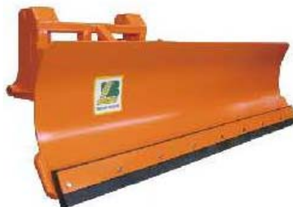
Abb. 642 Sněhová radlice s naklápěním - 35°, šířka 2 - 3,2 m, pracovní záběr 1,7 - 2,7 m, lze doobjednat gumový břit