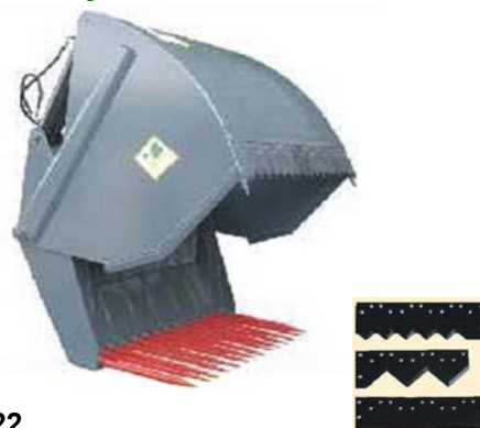
Abb. 622 Vidle na siláž s vykusovačem typ "C", objem 1,4 - 1,78 m 3 , šířka 1,57 - 1,99 m, lze vybrat ze tří břitů