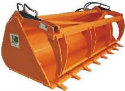
Abb. 633 Lžíce s přídržovákem a zuby, objem 0,9 - 1,35 m 3 , šířka 1,6 - 2,4 m