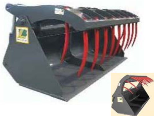
Abb. 617 Lžíce na siláž s přidržovákem typ "AS", objem 0,91 - 1,62 m 3 , šířka 1,6 - 2,8 m, lze doobjednat druhé boční špice