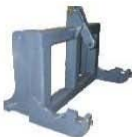
Abb. 647 Adaptérový rám - z JCB nástavby na třibodový závěs kat. I. (750 mm), kat. II. (850 mm) nebo kat. III. (950 mm)