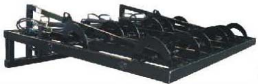
Abb. 615 Drápakový nosič hranatých balíků