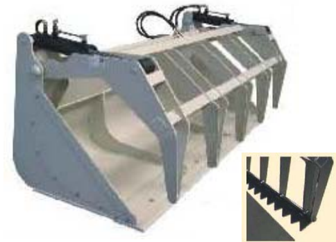
Abb. 634 Multifunkční lžíce s přídržovákem a odnímatelnými boky, objem 1,47 - 2,38 m 3 , šířka 1,6 - 2,6 m, lze doobjednat břit na přídržovák