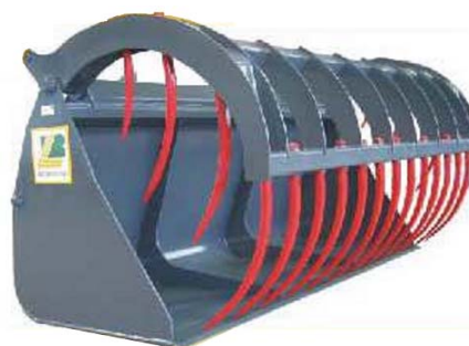
Abb. 620 Lžíce na siláž s přidržovákem typ "A XXL", objem 3,45 - 4 m 3 , šířka 2,4 - 2,8 m, lze doobjednat vyměnitelný břit