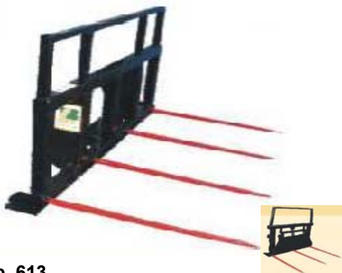
Abb. 613 Vidle na hranaté balíky s nosností 1,2 - 3 t, délka špicí 1,1 m, lze doobjednat výtlačné čelo