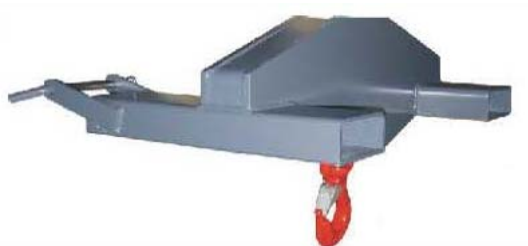
Abb. 637 Jeřábové rameno na paletové vidle, nosnost 3,2 t