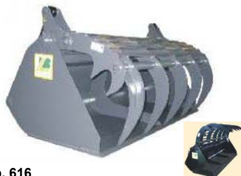
Abb. 616 Lžice na siláž s přidržovákem typ "S", objem 0,84 - 2,80 m 3 , šířka 1,65 - 2,4 m, lze doobjednat vyměnitelný břit