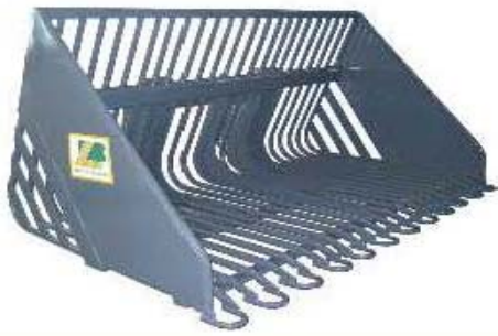
Abb. 629 Lžíce na řepu, objem 0,9 - 2,6 m 3 , šířka 1,8 - 2,6 m