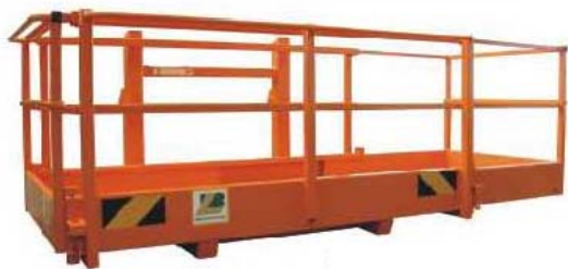
Abb. 641 Pracovní plošina typ "BLA III", nosnost 480 kg, šířka 2,4 m