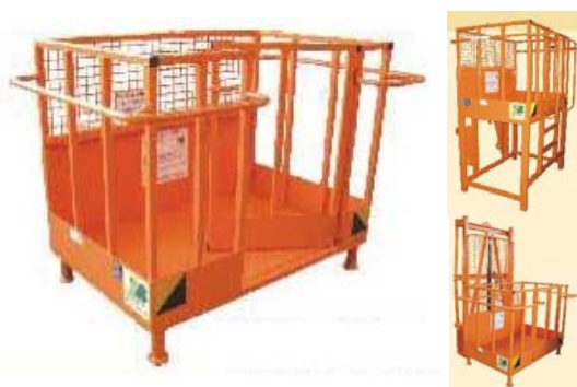
Abb. 639 Pracovní plošina typ "BLA I", nosnost 250 kg, šířka 1,3 m, lze doobjednat nástavec nebo zdvihové zařízení